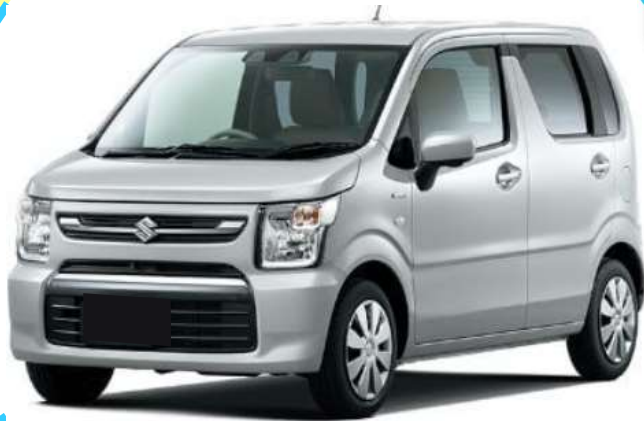
★スズキセーフティサポート付き★