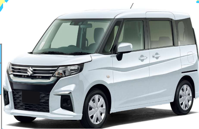
★スズキセーフティサポート付き★